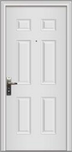
Cod. 37451142 IZQ Cod. 37451141 DER