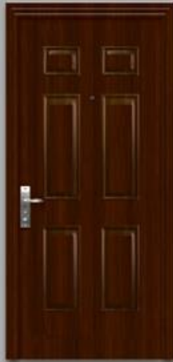
Cod. 37451153 IZQ Cod. 37451143 DER